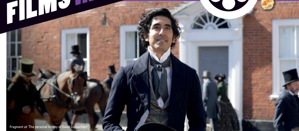
Fragment uit 'The personal history of David Copperfield'